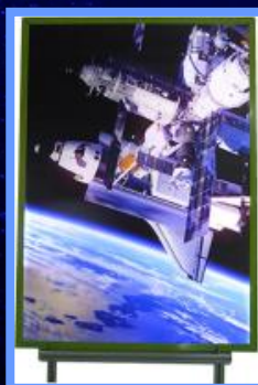
A0サイズ ポスター掲示用ライトボード