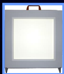
エッジライト調光式照明